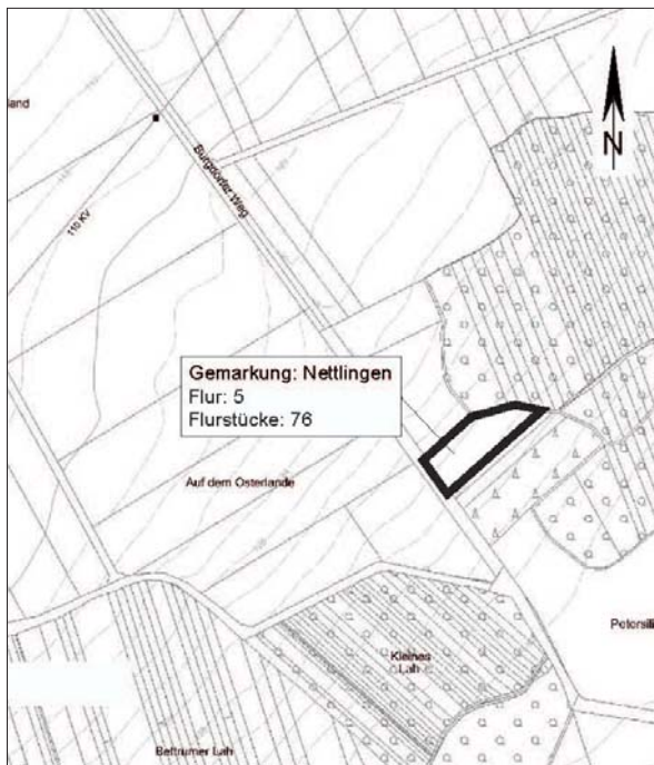
Karte 3: Lage der externe Ausgleichsfläche, anzurechnender Anteil für den Bebauungsplan Nr. 9 "Feuerwehr / Gewerbe" - Teil Gewerbegebiet

Das gewählte Flurstück Nr. 76, Flur 5, Gemarkung Nettlingen liegt zwischen den Ortschaften Nettlingen und Berel westlich des Waldgebietes Himstedter Lah (siehe Karte 3) und wird derzeit großteils als Acker und kleinflächig als Grünland genutzt.